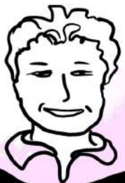
TABLE RONDE - 10 JUIN 2024 - CNAM -